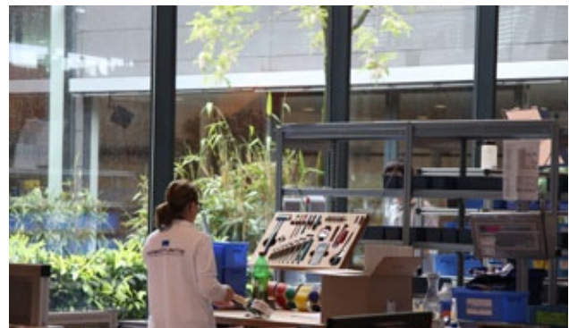
Entspannte Arbeitsplätze in der Fertigung