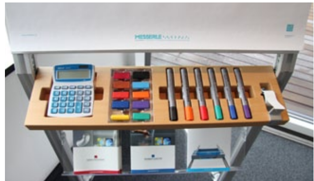
Shadow-Board am Flipchart